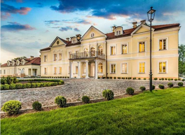
VI und VII) Hotel *** in Sobienie Szlacheckie