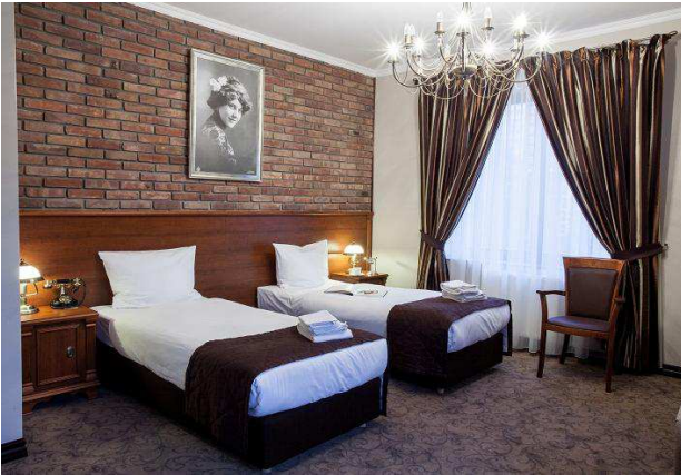
III-IV) Hotel *** in Pulawy,