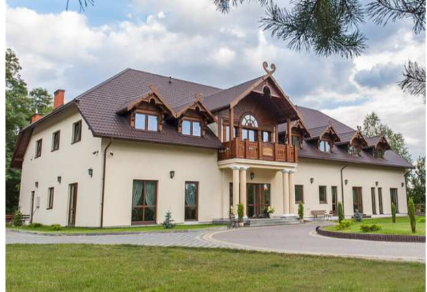
V) Gasthof in der Nähe von Kozenice,